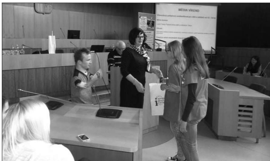
Předání ocenění z rukou Mgr. Vlasty Bohdalové, poslankyně Poslanecké sněmovny Parlamentu České republiky, a paraolympionika Arnošta Petráčka zástupkyním 15 členné redakční rady Volaráčku Zdeňky Podroužkové, Petře Maxové

S možnostmi, které školákům nabízí nejrůznější projekty, se redaktoři seznámili ve 2 vystoupeních studentů a žáků, kteří se zúčastnili mezinárodních filmových workshopů a festivalů v Rumunsku a v Maďarsku. Učte se angličtinu, zaznělo několikrát!