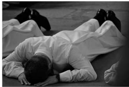
Svatost Kristova Těla a jeho Krve ať nám slouží k věčnému životu